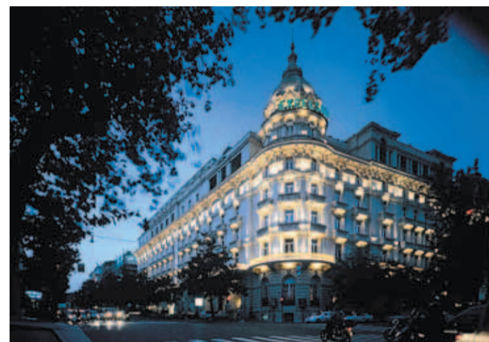
El Excelsior, un hotel centenario en la Via Veneto

El hotel es centenario, pero luce como en sus mejores días. El Excelsior de Roma ha sido objeto de una profunda renovación en los últimos años a fin de recuperar el esplendor de tiempos pasados. De hecho, el establecimiento sirvió para alojar a los actores de La dolce vita , además de aparecer en algunas de sus escenas en la Via Veneto, de tal modo que el éxito de la película convirtió al Excelsior “en un lugar de peregrinación, como el Coliseo, los Museos Vaticanos, el Capitolino, la columna de Trajano, las termas o San Pedro”, según escribió en su día este viajero de mil paisajes que es Manuel Leguineche. Los paparazzi pasaron del celuloide a la realidad y merodeaban en los años sesenta para captar con sus objetivos las peleas de Ernest Borgnine con su esposa, la temperamental Katy Jurado, o las broncas de Peter O’Toole con la prensa, mientras perseguía a la actriz Barbara Steele. O los intentos de Dino De Laurentiis en convertir en estrella a la princesa Soraya.