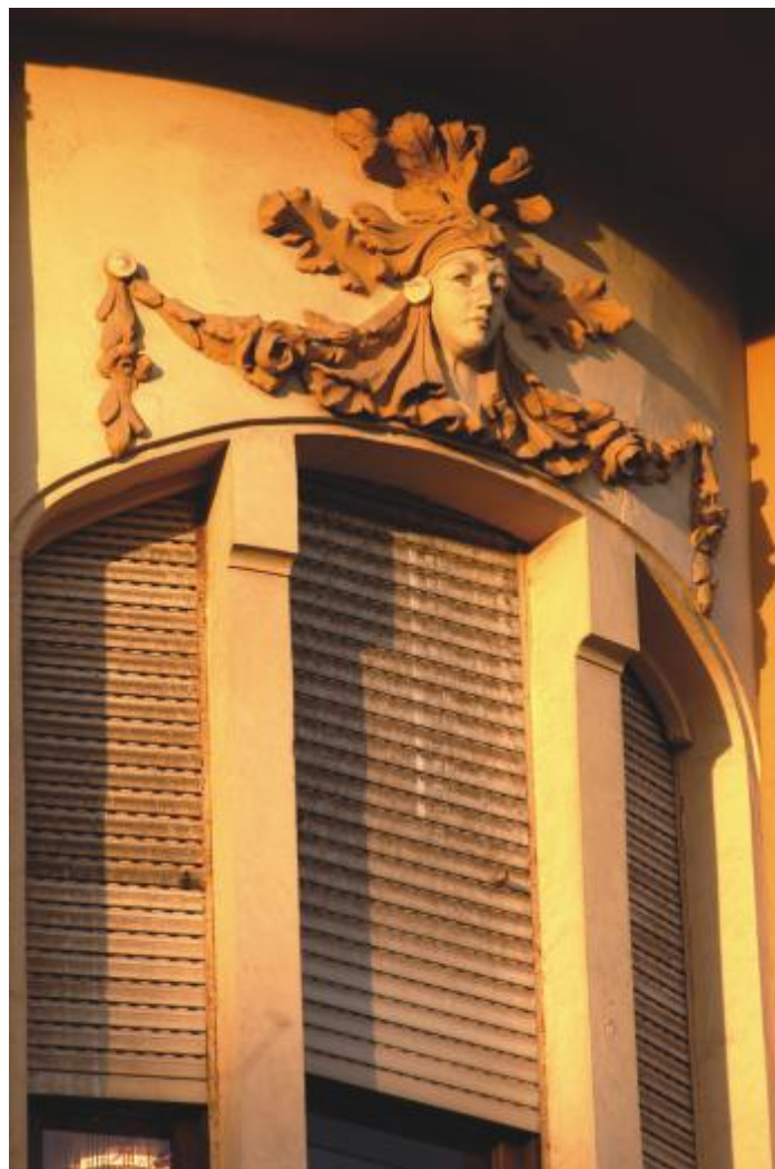
Enric Nieto, 1914. Decorative detail on the façade of La Reconquista building