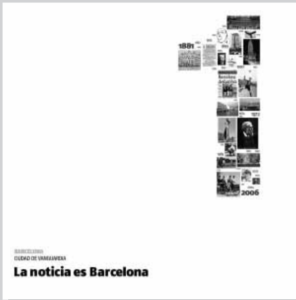
LA NOTICIA ES BARCELONA CUNA DE GRANDES EMPRESAS