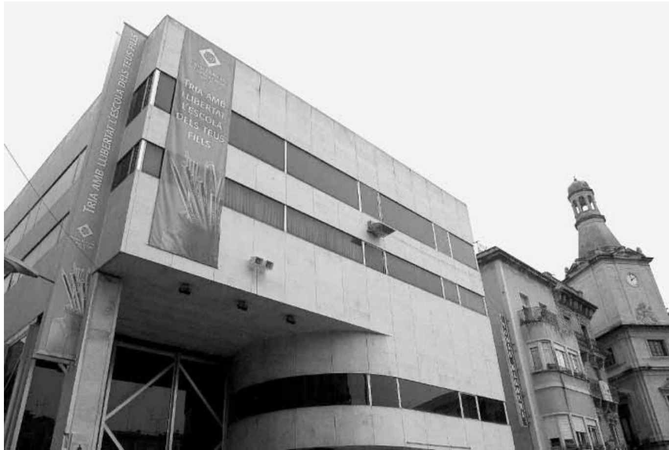
El edificio que tiene que albergar la Capsa Gaudí acoge actualmente la Oficina Municipal d'Escolarització de Reus