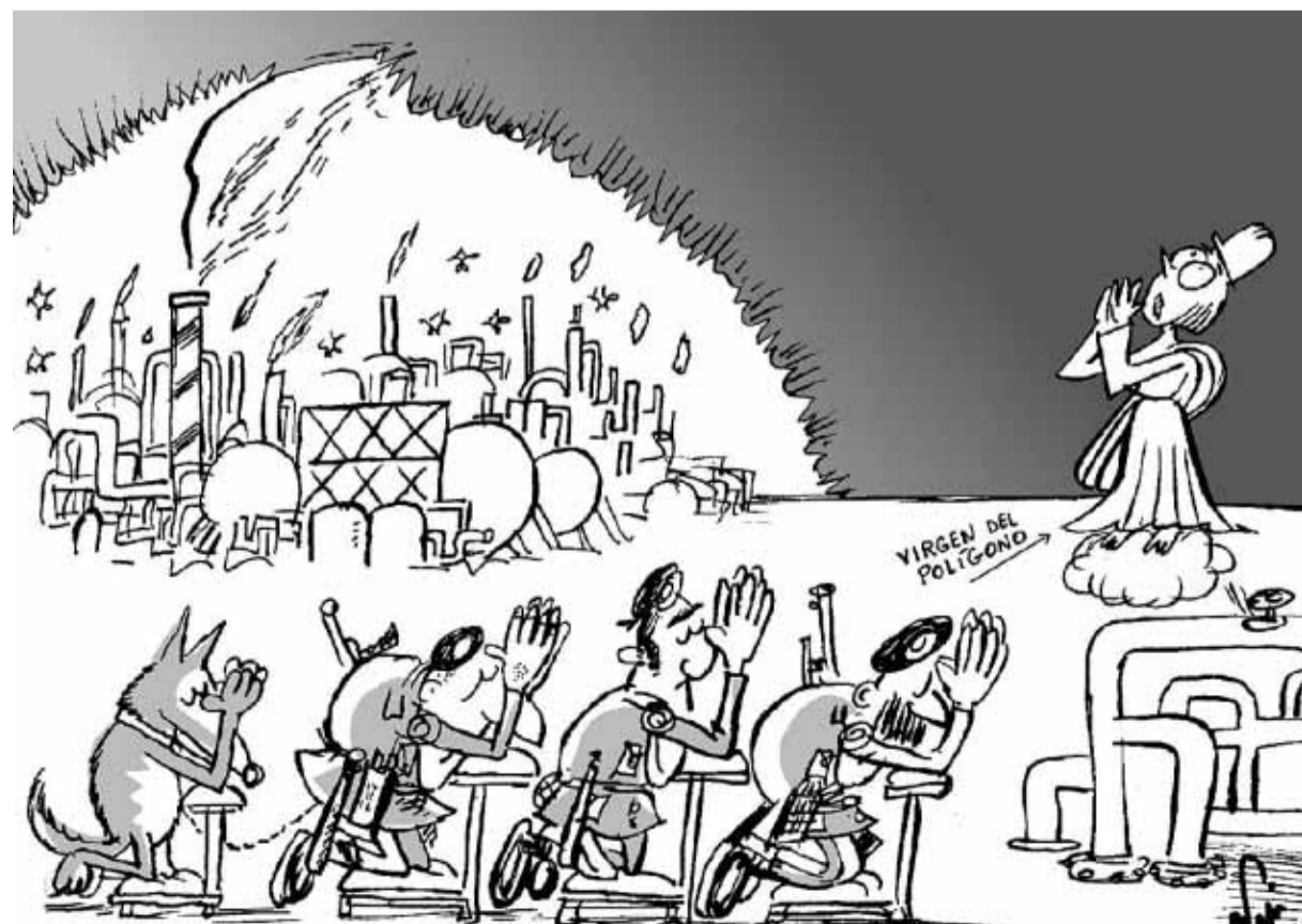
FUERZAS ESPECIALES PREPARANDOSE PARA VIGILAR EL COMPLEJO PETROQUÍMICO