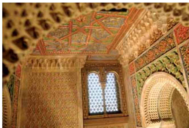
L'estil arabitzant va ser escollit per a la sala de bany El estilo arabizante fue escogido para la sala de baño