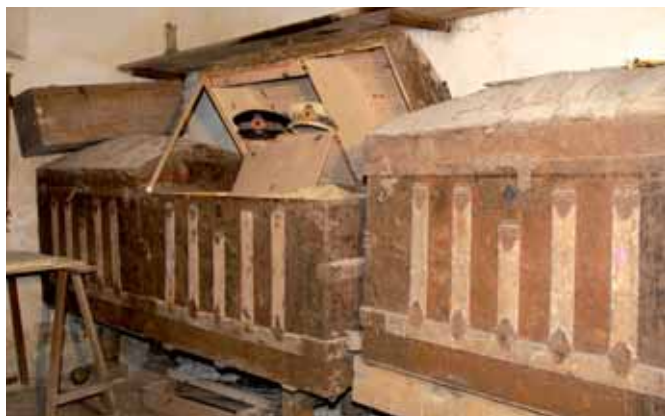
A Can Gallet, la casa de Bonaventura Puig, a Blanes, es guarden els mundos d'anar a Cuba