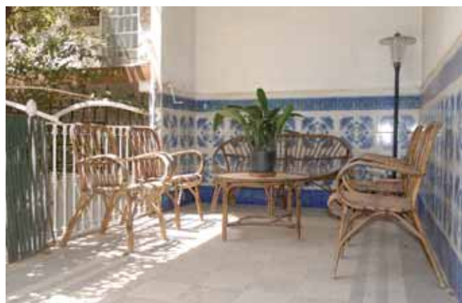
La seva casa amb jardí, Can Gallet, al carrer de l’Esperança 14, és la més luxosa d’aquest carrer d’americanos blanencs

El exotismo que rodeaba a los indianos fue abonado por la literatura y el teatro, a pesar de que no todos ellos se pasaban el día echando de menos el ron y las mulatas ni hablando una melaza lingüística de catalán-cubano como en El depatriat de Rusiñol. 10 Las palabras cubanas que usaban los indianos arraigaron enormemente entre la población del litoral donde se hablaba de las suripantas o las churrianas para designar a las mujeres de mala vida, de los jacarandosos o personas muy alegres o de hacer el chevere para designar a los que se comportaban como un chuleta. 11 El catalán hablado en el otro lado del Atlántico se vio también contaminado. Cuando el comediógrafo Eduard Aulés*, 12 de la escuela de Pitarra , regresó a Barcelona, tras diecisiete años en Cuba, el director de L’Esquella de la Torratxa , Antoni López, le pidió unas líneas para los lectores. Aulés escribía: