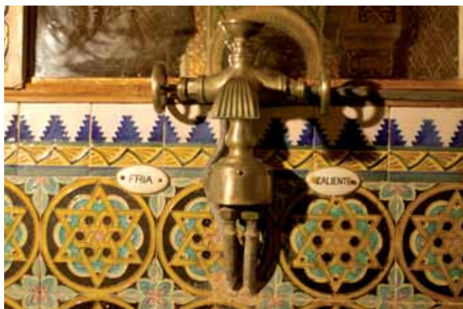
Gran modernitat, disposar d'aigua corrent calenta i freda Gran modernidad, disponer de agua corriente caliente y fría