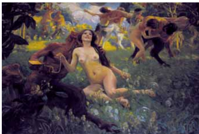
Un quadre eròtic presideix la sala gran de la Plana Novella Un cuadro erótico preside la sala grande de la Plana Novella