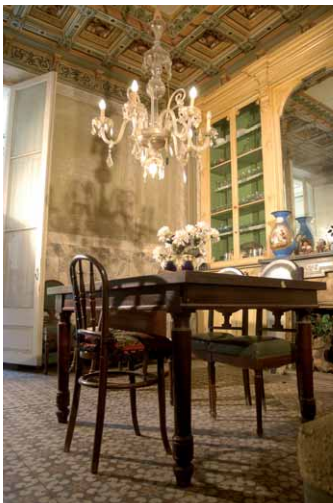
Tant Bonaventura Puig com el seu fill Rogeli van ser alcaldes de Blanes. El primer el 1898 i el segon, del 1939 al 1944