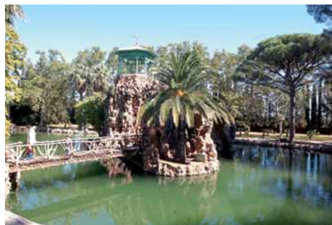
El gran llac i jardins del Parc Samà de Cambrils estan oberts al públic El gran lago y jardines del Parc Samà de Cambrils están abiertos al público