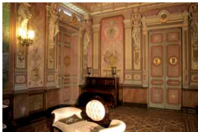
La sala gran del palau de la Plana Novella, a Olivella La sala grande del palacio de la Plana Novella, en Olivella

sa Caleta de Lloret de Mar, es va erigir l'any 1978 un monument als indians pobres, dels quals eufemísticament es deia que "havien perdut la maleta a l'Estret". 3